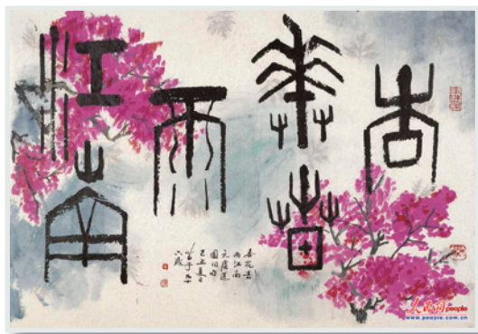
▲ 2009年作「杏花春雨江南」