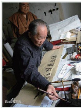
▲ 向苗子索字的人越來越多

「我已經同幾位來往較多的『生前好友』有過約定，趁我們現在還活著之日起，約好一天，會做輓聯的帶副輓聯（畫一幅漫畫也好），不會做輓聯的帶個花圈，寫句紀念的話，趁我們都能親眼看到的時候，大家拿出來欣賞一番。這比人死了才開追悼會，嘩啦嘩啦掉眼淚，更具有現實意義。」