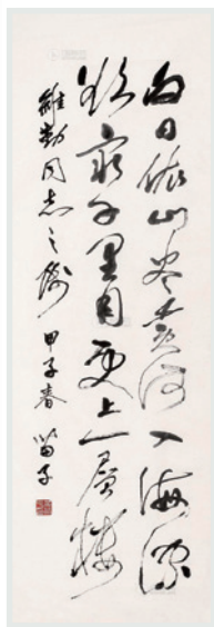
▲ 苗子行草《登鶴雀樓》