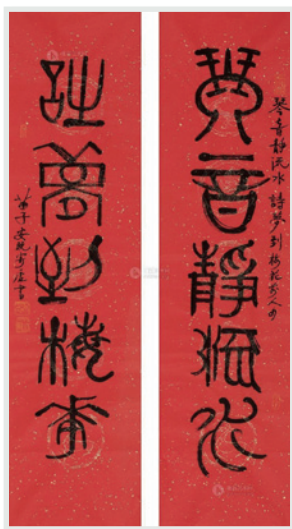
▲ 黃苗子篆聯《琴音靜流水 詩夢到梅花》