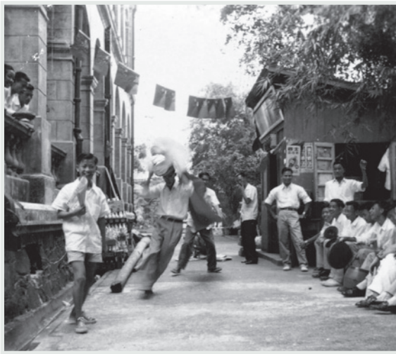
▲ 羅便臣道123號校舍外圍有寬敞校園

第三次努力，總算找到羅便臣道123號一座大樓，面臨羅便臣道，背枕旭蘇道，前後左右都被竹樹環繞，一大片空地，可作集會廣場及球場之用（這在香港是可遇而不可求的），樓高兩層，正門大堂，樓梯廣闊。最合作校舍之用；加上樓底極高（13呎），走馬騎樓，光線充足，空氣流通，足供10班課室及各科特別室用。可是那時校舍的周圍，野草遍生，門窗都付闕如，柚木地板及天花板破爛不堪，幸好租金尚算合適，於是復校工作迅速進行。