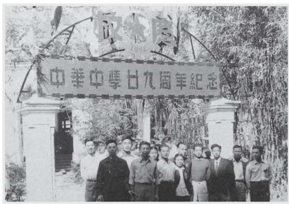
▲ 羅便臣道123號校舍正門

因為人手少，校工又不懂事，一些瑣事，都得自己親為。那時正是農曆新年，整個香港，都給新年的氣氛籠罩了。可幸幾年戰爭，已經把我們的習俗洗得淨盡，「過年」並未阻礙我們的工作。經過兩次察看，決定了。首先將屋內