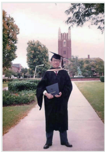
▲ 1991年在美国奧克拉荷瑪城大學校園留影

1980年日校結束，他轉職到太平保險有限公司工作，並取得公司領導同意繼續堅持夜校工作，而在業務上他要從零開始。剛巧他其中一些師傅是他原來的學生，他抱著達者為先的態度甘當學生的學生。他常以一句諺語『The early bird catches the worm』(早著先機)來鼓勵自己，自覺進修保險及工商管理知識，盡快提升自己。首先修讀了理工大學香港管理進修文憑課程(DMS)。90年初，他更報讀美國奧克拉荷瑪城大學的工商管理碩士課程。當時與他一起應試的是一群正規大學畢業的年輕業界專才，加上要到美國與日校學生一起考試，更糟糕的是在他代表其集團洽談上海浦東開發項目時發生意外，斷了三條肋骨，需要一段較長的時間養傷，導致有一個學科不能上課。後來幾經爭取，校方才批准自修應考。他能戰勝這些不利條件嗎？結果是：在12份考卷中，他以8A、3B、1C的優異成績完了他的大學校園夢！他的鑽研精神真是有點不可思議。