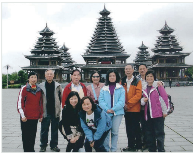
▲ 顏氏家族重視組織家族旅遊活動

中國太平保險集團投資有限公司董事、中國交銀保險有限公司獨立非執行董事。文浩校友關心窮苦大眾，退休後積極參與一些帶扶貧性質的活動，又資助內地貧困的農民子弟上大學。