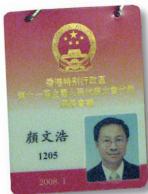
▲ 第11屆全國人代會議代表選舉會議的入場證

他遇上了好上司。先後得到多位上司的提攜，委以重任，使他在多方面的實踐機會中作自我提升：通過代表集團與香港各大集團合作，如東方廣場、盈科保險等項目，擴闊了視野。通過買路、買橋、買樓建樓、項目貸款、買大廈命名權等實踐，提高了投資專業水平。通過代表集團出任香港各界慶祝回歸委員會委員；代表集團出選作為中國企業協會的代表出任第2、3屆香港特別行政區800人選舉委員會委員；第十一屆全國人民代表大會代表選舉會議成員；代表公