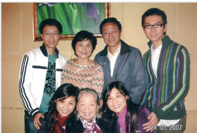
▲ 顏老師伉儷與兩位女兒及女婿