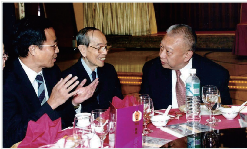
▲ 顏老師(左)與李鴻子校長(中)向首任特首董建華校友(右)介紹夜校情況

中國太平保險集團投資有限公司董事、中國交銀保險有限公司獨立非執行董事。文浩校友關心窮苦大眾，退休後積極參與一些帶扶貧性質的活動，又資助內地貧困的農民子弟上大學。