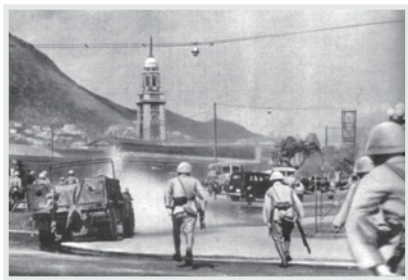
▲ 1941年12月8日寇進佔尖沙咀一帶

夜幕低垂，我們集中在運動場中央，表演隊伍組成「工」、「合」兩個字。「工業合作社」是宋慶齡倡導下的一個組織，表面上是推動中國的農村組成手工業合作以發展生產、改進農民生活，實際上是利用這個組織的名義在香港購買物資以支持解放區所需。我團以「工合」隊形出場，正是黃祖芬校長藉此場合，宣傳支援抗戰的「工業合作社」。