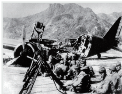
▲ 開戰後即遭日軍攻擊的啟德機場