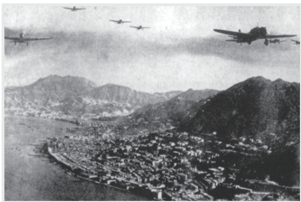
▲ 1941年12月8日，日本向香港發起進攻。

結束，會上演出文藝節目。當晚中華中學幾乎是全校出動，師生們表演節目，家長們購票進場。本人雖然是高小學生亦要參演兩個節目：體操表演和大合唱。當年母校的集體操在校際小學比賽中得過獎（是否冠軍查找不到確實資料），本人是校隊成員。