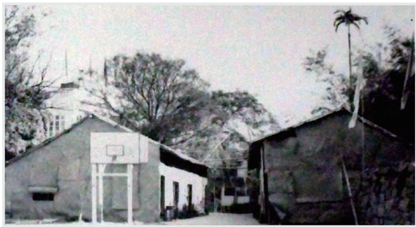
▲ 羅便臣道123號校舍，1958年在籃球場搭起竹棚課室上課。

前的環境，真是一件相當困難的工作。因為每個學期各班都有新同學，他們來自各校，課程不一致，進度又有先後，教起來真感吃力，然而這個困難我們必需克服的，斷不能因循敷衍，貽誤年。我們鑒於這個實際情況，所以每學期在上課前便召開各科組會議，定好各科教學計劃。