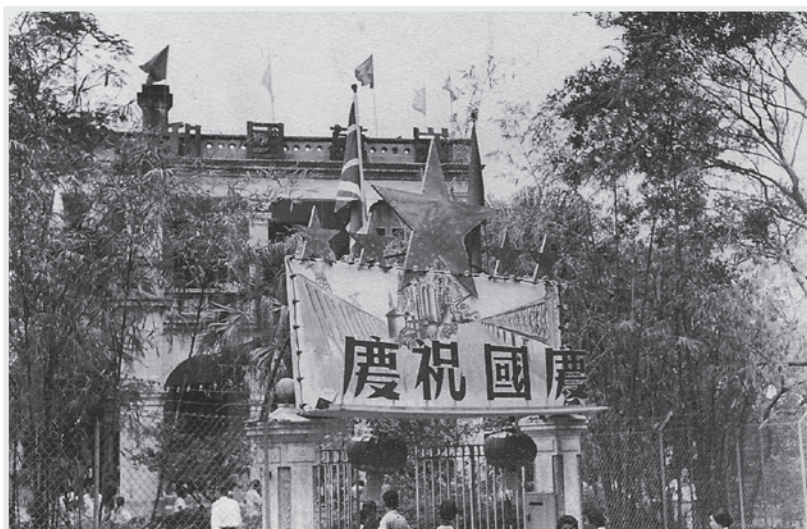
▲ 重視愛國主義教育，每年10月1日均有慶祝國慶活動。