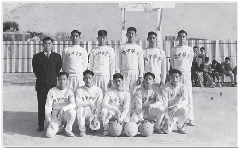
▲ 重視體育鍛鍊，這是1956年母校籃球隊出征澳門比賽的陣容。

學生健康是我們向來重視的。因為有了健的體魄，才有充沛的精力去學習與遊戲。我們的環境優美，且不乏運動設施，最適宜進行體育鍛鍊。本學期雖然蓋搭臨時課室佔了一個球場的面積，修繕校舍的工程部也使用了田賽場，但還有足的場地為學生提供體育活動，我們還可以利用附近的路面練習中距離和長途賽跑。