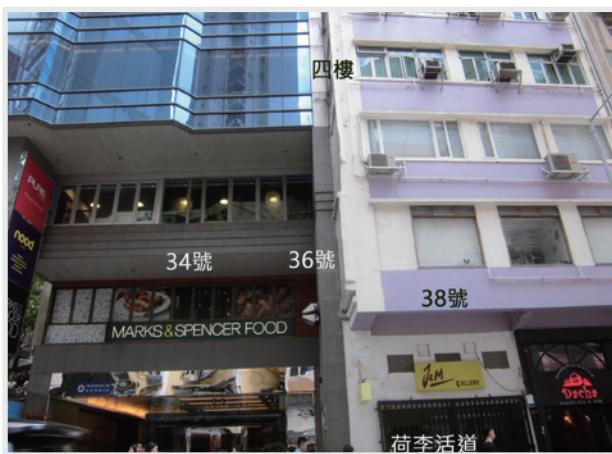
▲ 現在荷李活道34-38號的面貌。